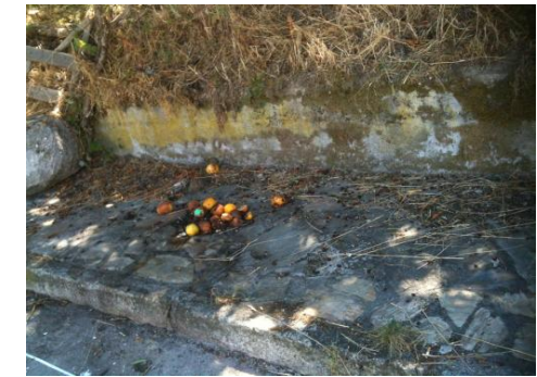
Plaza Gabino García antes de la Creación del Área de la Leyenda